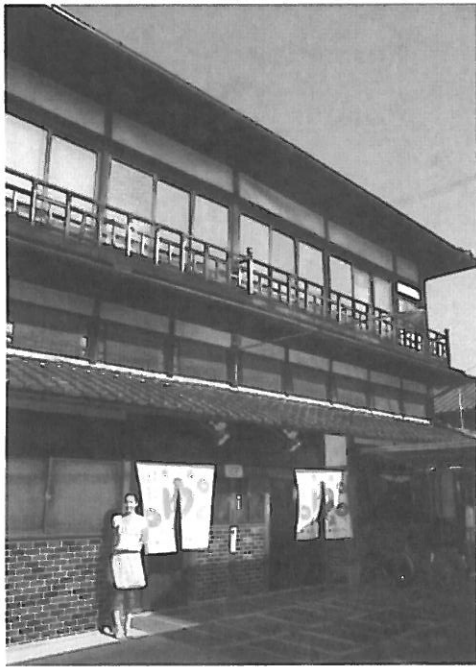
京都会場・日の出湯（京都・東寺通）

関西の銭湯ファンらによるトークイベント「ふろいこか〜」が、昨年に引き続き今年も行われる。今年は京都・大阪両会場ともに伝統的なレトロ口銭湯の脱衣所を舞台に、銭湯の魅力が発信される。