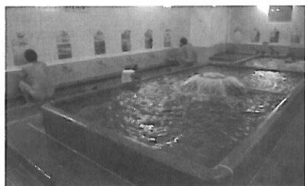
寿温泉の伝統的な石造りの浴室