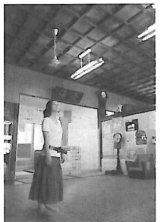
会場となる日の出湯の脱衣場