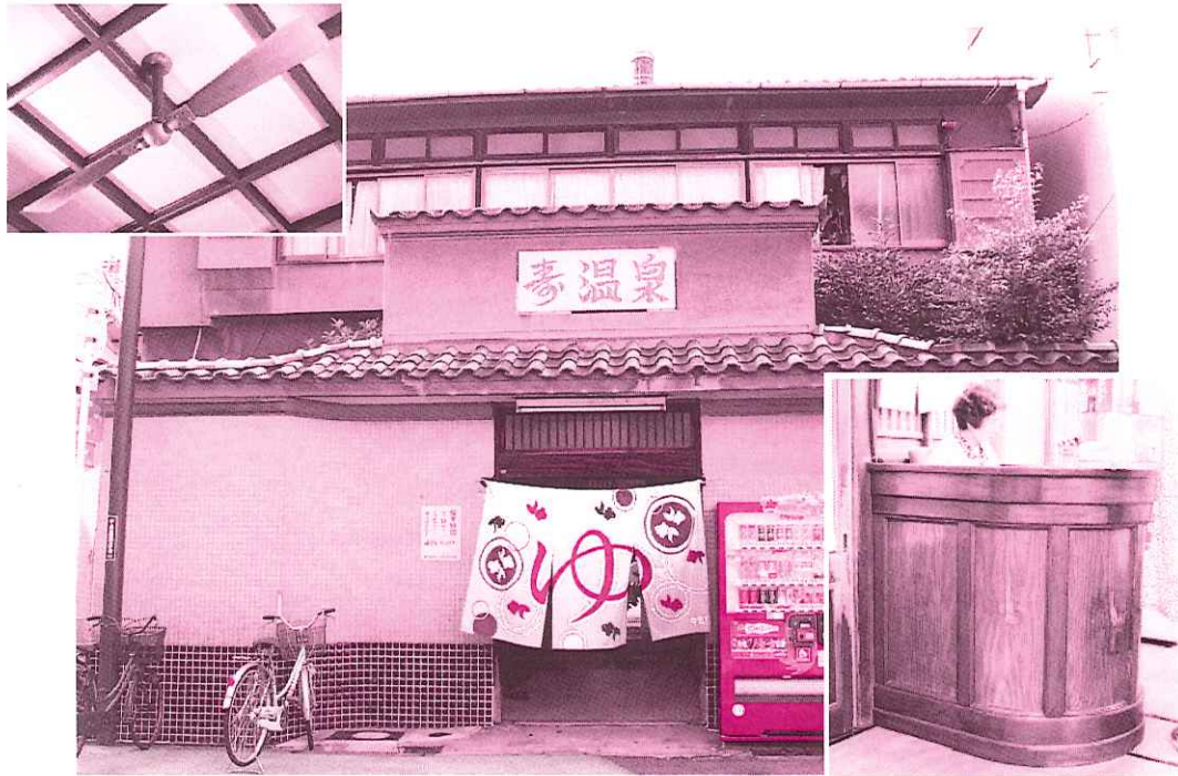
ふろいこか〜 2010 の会場となる寿温泉 (JR環状線・弁天町駅から徒歩約7分)

11/7 寿温泉 (大阪市港区) にて 関西の銭湯ファンらによるトークイベント「ふろいこか〜2010」が、京都に続いて大阪でも開催される。伝統的な銭湯の脱衣所を舞台に、銭湯の魅力がこれでもかと力をこめて発信される。