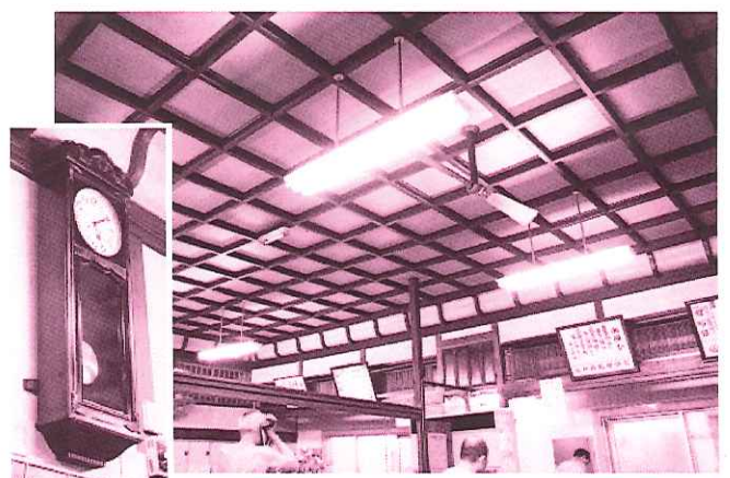
寿温泉の脱衣場。豪華な格天井が魅力!